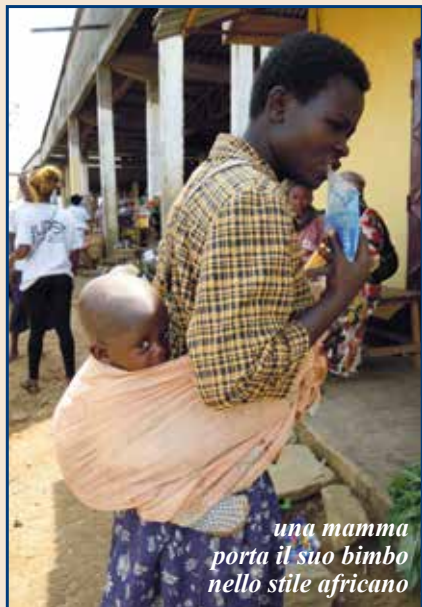
una mamma porta il suo bimbo nello stile africano