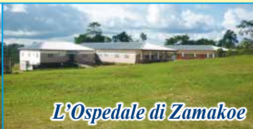
L'Ospedale di Zamakoe