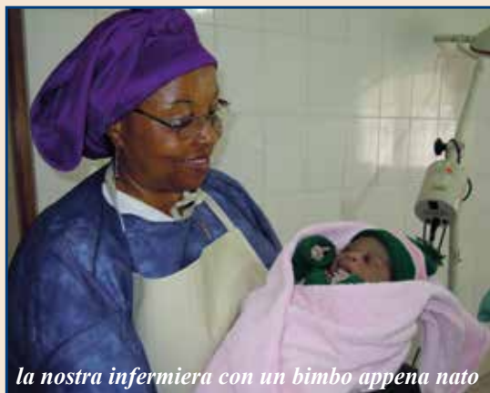
la nostra infermiera con un bimbo appena nato