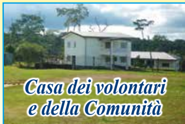
Casa dei volontari e della Comunità