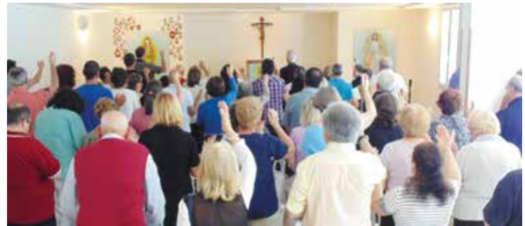
i Sacerdoti presenti benedicono i pellegrini...