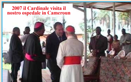
2007 il Cardinale visita il nostro ospedale in Cameroun

Nell'affidare la sua anima al Signore, gli siamo grati delle particolari attenzioni che sempre ha manifestato ed avuto in tutti questi anni per le Opere da noi fondate e soprattutto per il sostegno al carisma che muove le opere a favore degli ultimi della terra.