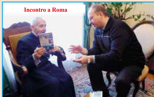
Incontro a Roma