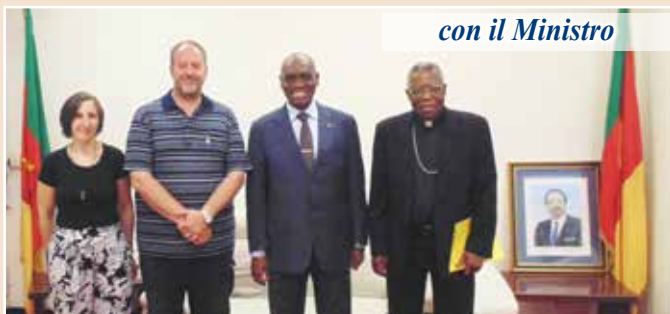
con il Ministro