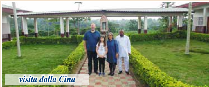
visita dalla Cina