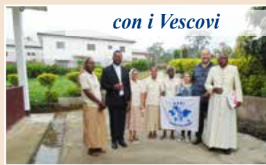
con i Vescovi