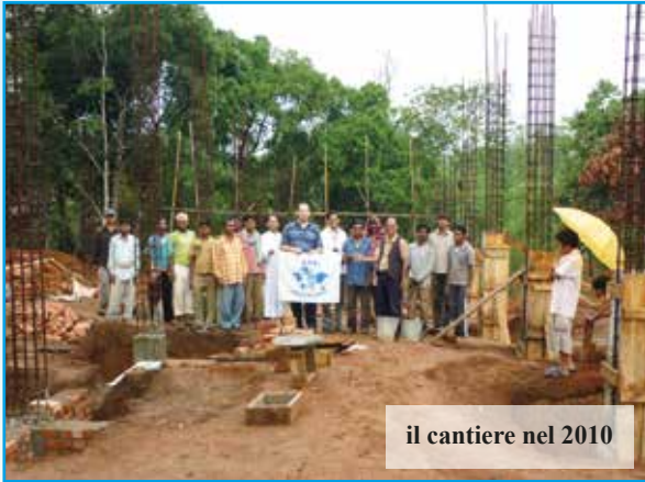
il cantiere nel 2010