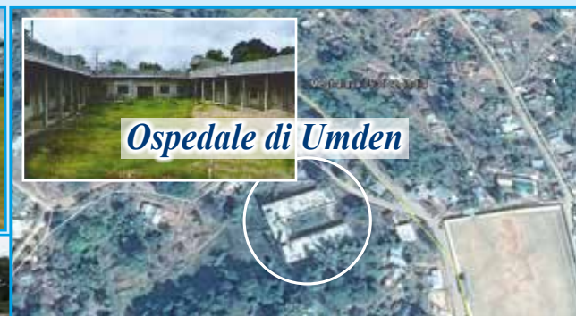
Ospedale di Umden