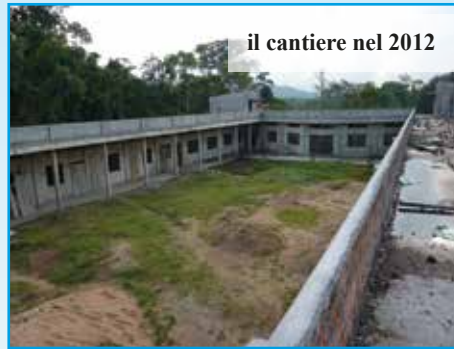
il cantiere nel 2012

Il cantiere per la costruzione dell' Ospedale "MOTHER OF LOVE - UMDEN" è iniziato nel dicembre 2008. Ad oggi tutta la parte strutturale e muraria è finita. Il costo per la costruzione globale, rivista in questi mesi, si aggira sui 225.000 euro . Ad oggi abbiamo mandato oltre 150.000 euro, circa i tre quarti di questa somma. Pubblichiamo lo stato di fatto della costruzione prima della recente ripresa dei lavori. L'Arcivescovo Mons. Dominic Jala ha confermato di aver preso accordi con una comunità di suore che collaborerà e lavorerà proprio nell'Ospedale per aiutare nei vari servizi una volta ultimata l'opera.