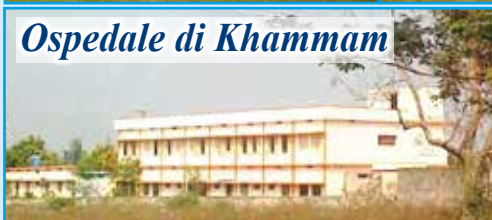
Ospedale di Khammam