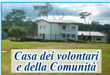
Casa dei volontari e della Comunità

Chi desidera può sostenere la realizzazione di pozzi per dare acqua ai poveri villaggi di Khammam in India. Vi informiamo che per la trivellazione di un pozzo servono 500 euro . Coraggio, aiutiamoli!