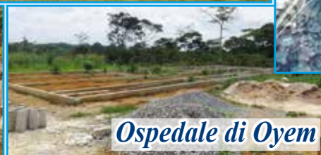
Ospedale di Oyem

Le fotografie dei quattro Ospedali fondati: Zamakoe (Africa) e Khammam (India) che sono già operativi mentre Umden (India) e Oyem (Africa) che sono in costruzione.