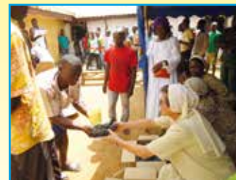
Giornata della misericordia alle prigioni di Mbalmayo domenica 26 marzo 2017

Dopo la visita al nostro progetto da parte dei responsabili dell'Associazione (febbraio 2017) sono stati confermati presso l'Ospedale "NOTRE DAME DE ZAMAKOE" tutti i progetti ed i servizi nati per i più poveri. Ogni giorno è garantita la presenza di medici per le consultazioni e le visite. Per il reparto di chirurgia è stato confermato il medico chirurgo che ormai lavora da noi da oltre un anno. Ogni mese sono decine ormai le operazioni chirurgiche. Il nostro impegno mensile per sostenere il progetto si aggira sui 2.000 euro necessari per il mantenimento della struttura (farmacia, stipendi del personale, attrezzature, manutenzioni ordinarie, ecc...). In questa zona dell'Africa sono poche, pochissime, le persone che possono lasciare qualche contributo durante la loro permanenza in Ospedale e, come sapete, in Africa non esiste il sistema nazionale sanitario o assicurativo in caso di malattia. Aiutare questo Ospedale vuol dire salvare vite umane! Il vostro aiuto è fondamentale per la sopravvivenza di questa opera meravigliosa!