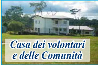
Casa dei volontari e delle Comunità