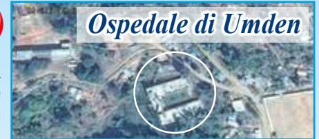
Ospedale di Umden