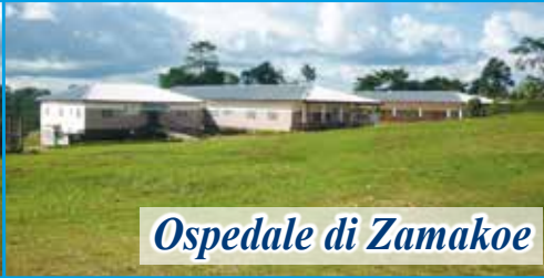
Ospedale di Zamakoe

Dopo la visita al nostro progetto da parte dei responsabili dell'Associazione (febbraio 2023) sono stati confermati presso l'Ospedale "NOTRE DAME DE ZAMAKOÈ" tutti i progetti ed i servizi nati per i più poveri. Ogni giorno è garantita la presenza di medici per le consultazioni e le visite. Per il reparto di chirurgia è stato confermato il medico chirurgo che ormai lavora con noi da anni. Ogni mese sono decine ormai le operazioni chirurgiche. Il nostro impegno mensile per sostenere il progetto è di 1.500 euro