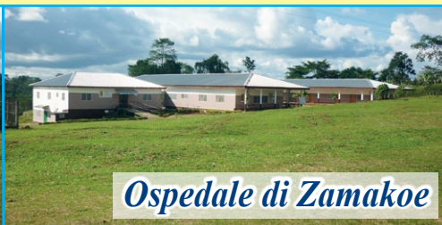
Ospedale di Zamakoe

Dopo la visita al nostro progetto da parte dei responsabili dell'Associazione (novembre 2024) sono stati confermati presso l'Ospedale " NOTRE DAME DE ZAMAKOË " tutti i progetti ed i servizi nati per i più poveri. Ogni giorno è garantita la presenza di medici per le consultazioni e le visite. Per il reparto di chirurgia è stato confermato il medico chirurgo che ormai lavora con noi da anni. Ogni mese sono decine ormai le operazioni chirurgiche. Il nostro impegno mensile per sostenere il progetto è di 1.500 euro