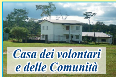
Casa dei volontari e delle Comunità