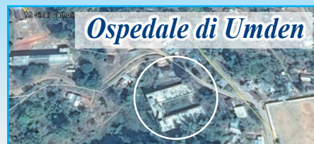
Ospedale di Umden