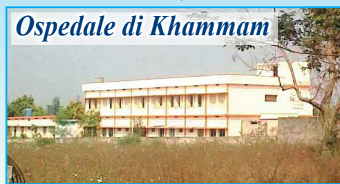
Ospedale di Khammam

In questo povero angolo dell'India, prosegue il nostro aiuto per la costruzione di pozzi d'acqua (ad oggi già scavati 40) e bagni a sostegno dei poveri villaggi della zona. In estate la temperatura arriva anche ai 45°C e la situazione diventa drammatica anche in campo sanitario. Ricordiamo che la somma necessaria per la realizzazione di un pozzo è di 500 euro e di un bagno di 250 euro . Con l'inaugurazione e l'apertura dell'Ospedale Pediatrico " DONO E CAREZZA DELLA MAMMA DELL'AMORE " nel villaggio di Morampally Banjara, dopo aver parlato con il Vescovo, l'associazione propone di " adottare a distanza " i bambini qui ricoverati (tutti sieropositivi o malati di AIDS) proprio per sostenere le spese di gestione, l'assistenza e le cure. Per ogni bambino sostenuto sarà richiesto un contributo annuale di almeno 200 euro .