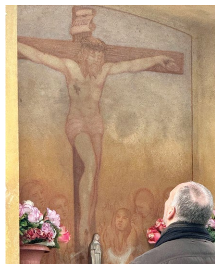
L'apparizione pubblica della quarta domenica del mese è avvenuta a Marco alle ore 15:40 dopo la processione e durante l'incontro di preghiera sulla collina a Paratico