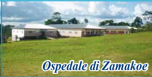
Ospedale di Zamakoe

Dopo la visita al nostro progetto da parte dei responsabili dell'Associazione (ottobre 2016) sono stati confermati presso l'Ospedale "NOTRE DAME DE ZAMAKOE" tutti i progetti ed i servizi nati per i più poveri. Ogni giorno è garantita la presenza di medici per le consultazioni e le visite. Per il reparto di chirurgia è stato confermato il medico chirurgo che ormai lavora da noi da oltre un anno. Ogni mese sono decine ormai le operazioni chirurgiche. Il nostro impegno mensile per sostenere il progetto si aggira