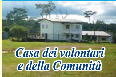
Casa dei volontari e della Comunità