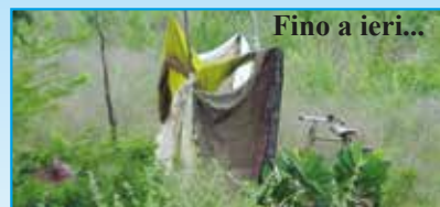
Primi bagni in costruzione!

Grazie a coloro che sostengono i progetti a favore degli ultimi della terra.