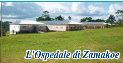
L'Ospedale di Zamakoe