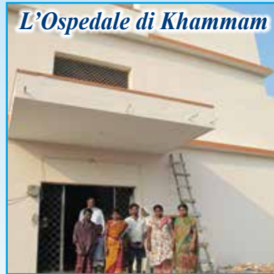
L'Ospedale di Khammam

11 FEBBRAIO 2015 inaugurazione e benedizione del primo Ospedale Pediatrico Cattolico dello stato Andhra Pradesh che sarà chiamato "Dono e carezza di Maria Mamma dell'Amore" da noi costruito a Morampally nella Diocesi di Khammam in India. Vi invitiamo a gioire con noi e rallegrarci nella grandezza della Provvidenza per i servizi che verranno offerti ai più poveri tra i poveri in forma gratuita.