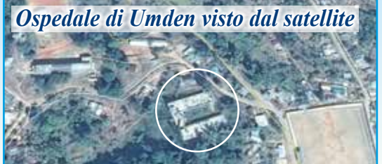
Ospedale di Umden visto dal satellite

Il costo per la costruzione si aggirava sui 225.000 euro . Ad oggi la nostra associazione ha mandato 165.000 euro, circa i tre quarti di questa somma. Grazie ad un accordo di fiducia reciproca, tra l'Ispettorato dei Salesiani, le ditte locali e alcuni magazzini di materiali edili, siamo riusciti ad avere una dilazione nei pagamenti e quindi ultimare tutti i lavori. È ancora fondamentale il nostro sforzo nel contribuire alle spese fatte che vanno liquidate nei prossimi mesi. Chi desidera può sempre sostenere questo impegno. La cosa importante è che ad oggi l'ospedale è stato ultimato ed è funzionante.