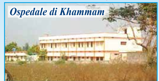
Ospedale di Khammam

In questo povero angolo dell'India, prosegue il nostro aiuto per la costruzione di pozzi d'acqua (ad oggi già scavati 36 pozzi) a sostegno dei poveri villaggi della zona. In estate la temperatura arriva anche ai 45°C e la situazione diventa drammatica anche in campo sanitario. Ricordiamo che la somma necessaria per la realizzazione di un pozzo è di 500 euro . Con l'inaugurazione e l'apertura dell' Ospedale Pediatrico "Dono e carezza della Mamma dell'Amore" nel villaggio di Morampally Banjara, dopo aver parlato con il Vescovo, l'associazione propone di "adottare a distanza" i bambini qui ricoverati (tutti sieropositivi o malati di AIDS) proprio per sostenere le spese di gestione, l'assistenza e le cure. Per ogni bambino sostenuto sarà richiesto un contributo annuale di almeno 170 euro .