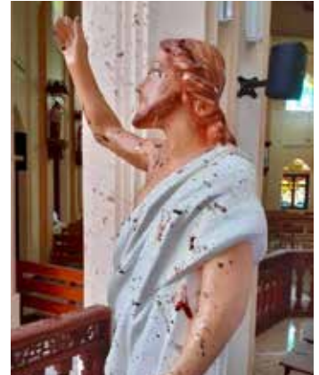
Statua presente nella chiesa dopo l'attentato

Con questo gesto noi tutti vogliamo confermare la nostra vicinanza ai Cristiani perseguitati per la loro fede, per la nostra fede, in tanti angoli del mondo... Preghiamo sempre per loro!