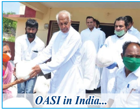
OASI in India...