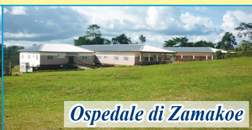
Ospedale di Zamakoe

Dopo la visita al nostro progetto da parte dei responsabili dell'Associazione ( giugno 2019 ) sono stati confermati presso l'Ospedale "NOTRE DAME DE ZAMAKOE" tutti i progetti ed i servizi nati per i più poveri. Ogni giorno è garantita la presenza di medici per le consultazioni e le visite. Per il reparto di chirurgia è stato confermato il medico chirurgo che ormai lavora con noi da anni. Ogni mese sono decine ormai le operazioni chirurgiche. Il nostro impegno mensile per sostenere il progetto è di 1.500 euro