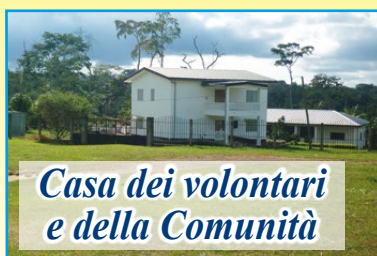
Casa dei volontari e della Comunità