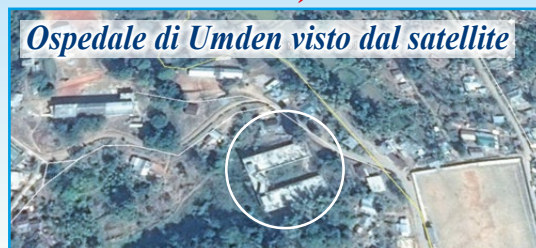
Ospedale di Umden visto dal satellite

Il costo per la costruzione si aggirava sui 225.000 euro . Ad oggi la nostra associazione ha mandato 175.000 euro. Grazie ad un accordo di fiducia reciproca, tra l'Ispettorato dei Salesiani, le ditte locali e alcuni magazzini di materiali edili, siamo riusciti ad avere una dilazione nei pagamenti e quindi ultimare tutti i lavori. È ancora fondamentale il nostro sforzo nel contribuire alle spese fatte che vanno liquidate nei prossimi mesi. Chi desidera può sempre sostenere questo impegno. La cosa importante è che ad oggi l'ospedale è stato ultimato ed è funzionante. Ogni giorno le suore ed il personale ricevono circa 200 pazienti.