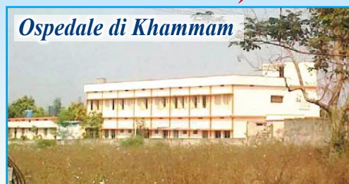
Ospedale di Khammam

In questo povero angolo dell'India, prosegue il nostro aiuto per la costruzione di pozzi d'acqua (ad oggi già scavati 40) e bagni a sostegno dei poveri villaggi della zona. In estate la temperatura arriva anche ai 45°C e la situazione diventa drammatica anche in campo sanitario. Ricordiamo che la somma necessaria per la realizzazione di un pozzo è di 500 euro e di un bagno di 250 euro . Con l'inaugurazione e l'apertura dell'Ospedale Pediatrico "DONO E CAREZZA DELLA MAMMA DELL'AMORE" nel villaggio di Morampally Banjara, dopo aver parlato con il Vescovo, l'associazione propone di "adottare a distanza" i bambini qui ricoverati (tutti sieropositivi o malati di AIDS) proprio per sostenere le spese di gestione, l'assistenza e le cure. Per ogni bambino sostenuto sarà richiesto un contributo annuale di almeno 180 euro .