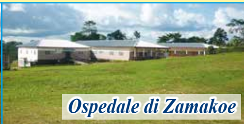
Ospedale di Zamakoe

Dopo la visita al nostro progetto da parte dei responsabili dell'Associazione (febbraio 2023) sono stati confermati presso l'Ospedale "NOTRE DAME DE ZAMAKOË" tutti i progetti ed i servizi nati per i più poveri. Ogni giorno è garantita la presenza di medici per le consultazioni e le visite. Per il reparto di chirurgia è stato confermato il medico chirurgo che ormai lavora con noi da anni. Ogni mese sono decine ormai le operazioni chirurgiche. Il nostro impegno mensile per sostenere il progetto è di 1.500 euro