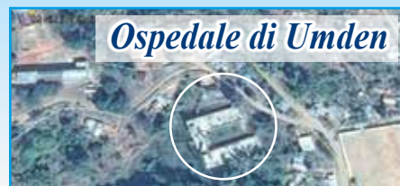
Ospedale di Umden