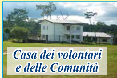
Casa dei volontari e delle Comunità