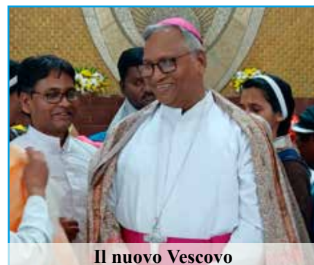
Il nuovo Vescovo