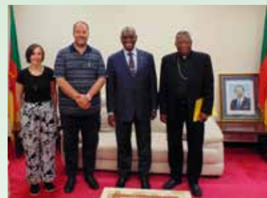
Elena dal Ministro in Cameroun

A nome di tutti noi gli auguri di ogni bene al Presidente per un buon "lavoro-missione" ricco di frutti di carità ed estendiamo questo augurio a tutti i collaboratori di "Oasi".