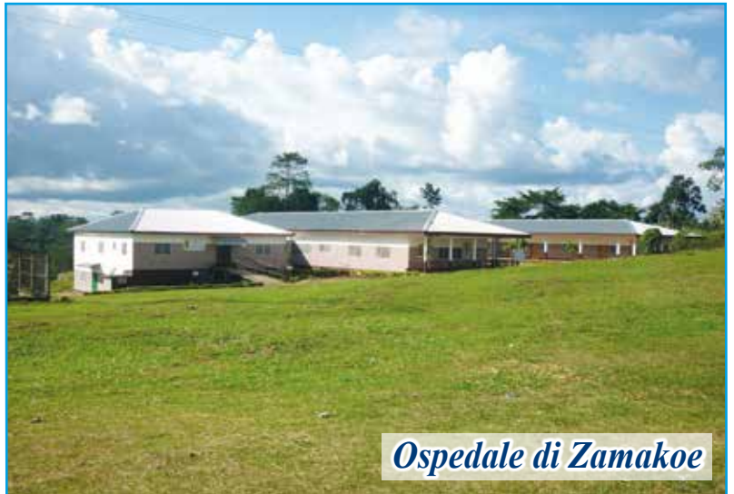
Ospedale di Zamakoe

** Il nostro Ospedale “Notre Dame de Zamakoe” è situato nel villaggio di Zamakoe che, con altri 5-6 villaggi, fa parte della Parrocchia di “San Giuseppe di Efulan” affidata alle cure pastorali dei Padri Carmelitani.