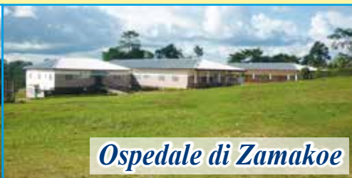
Ospedale di Zamakoe

Dopo la visita al nostro progetto da parte dei responsabili dell'Associazione (febbraio 2023) sono stati confermati presso l' Ospedale "NOTRE DAME DE ZAMAKOÈ" tutti i progetti ed i servizi nati per i più poveri. Ogni giorno è garantita la presenza di medici per le consultazioni e le visite. Per il reparto di chirurgia è stato confermato il medico chirurgo che ormai lavora con noi da anni. Ogni mese sono decine ormai le operazioni chirurgiche. Il nostro impegno mensile per sostenere il progetto è di 1.500 euro