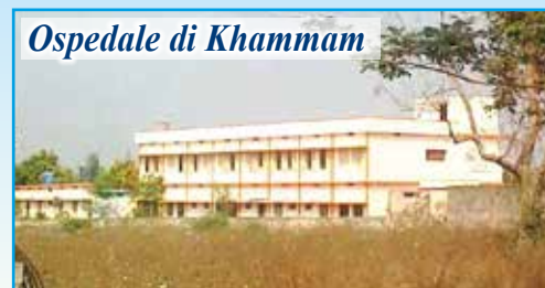
Ospedale di Khammam

In questo povero angolo dell'India, prosegue il nostro aiuto per la costruzione di pozzi d'acqua (ad oggi già scavati 40) e bagni a sostegno dei poveri villaggi della zona. In estate la temperatura arriva anche ai 45°C e la situazione diventa drammatica anche in campo sanitario. Ricordiamo che la somma necessaria per la realizzazione di un pozzo è di 500 euro e di un bagno di 250 euro . Con l'inaugurazione e l'apertura dell' Ospedale Pediatrico "DONO E CAREZZA DELLA MAMMA DELL'AMORE" nel villaggio di Morampally Banjara, dopo aver parlato con il Vescovo, l'associazione propone di "adottare a distanza" i bambini qui ricoverati (tutti sieropositivi o malati di AIDS) proprio per sostenere le spese di gestione, l'assistenza e le cure. Per ogni bambino sostenuto sarà richiesto un contributo annuale di almeno 190 euro .