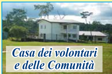
Casa dei volontari e delle Comunità