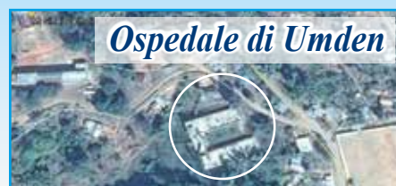
Ospedale di Umden