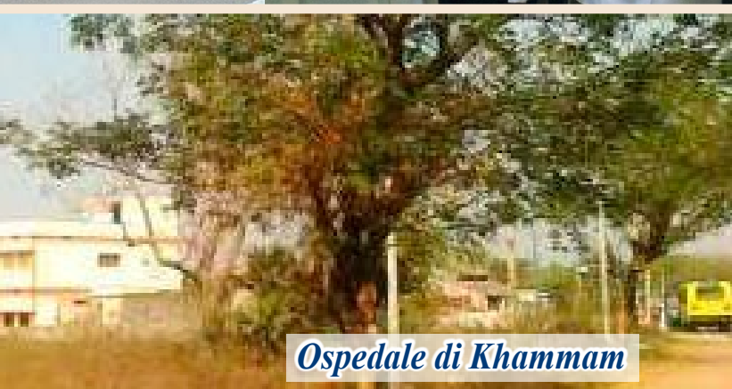
Ospedale di Khammam