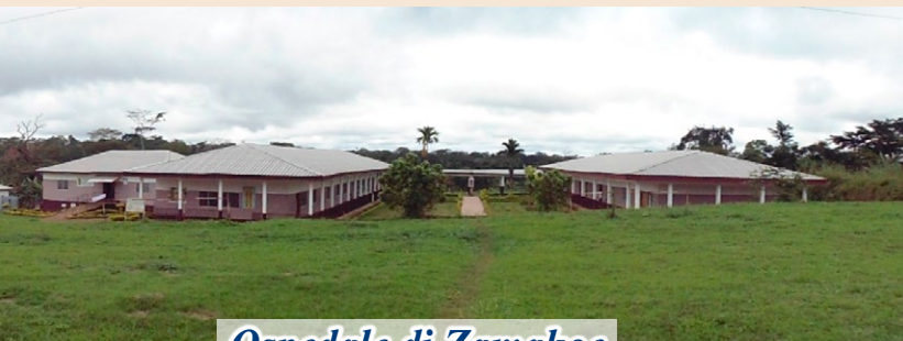
Ospedale di Zamakoe

la generosa lungimiranza di persone che hanno deciso di destinare parte del loro patrimonio alla nostra ONLUS contribuisce a migliorare la qualità dei progetti che si intendono realizzare.