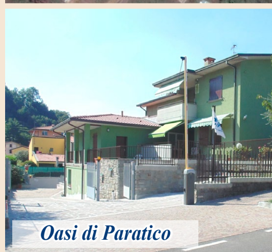
Oasi di Paratico