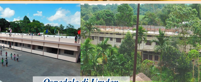
Ospedale di Umden