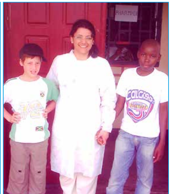
Incontro con il bambino salvato dall'amputazione nel 2009