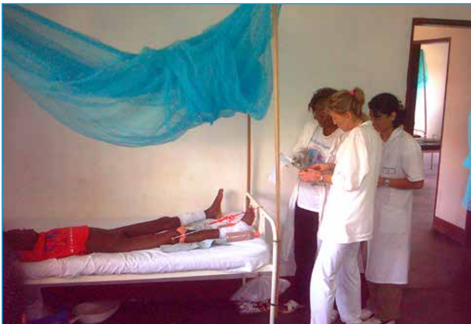
Primo incontro durante le visite del 2008