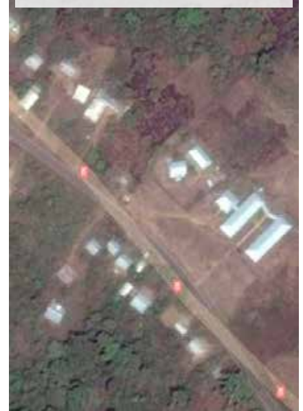
L'Ospedale del Cameroun visto dal satellite

Le nostre ASSOCIAZIONI sono sempre alla ricerca di volontari, collaboratori per la segreteria e personale socio-sanitario che ci possa aiutare nei servizi quotidiani nelle Oasi in Italia e all'estero. Per info chiamare 035913403.