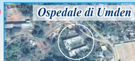
Ospedale di Umden