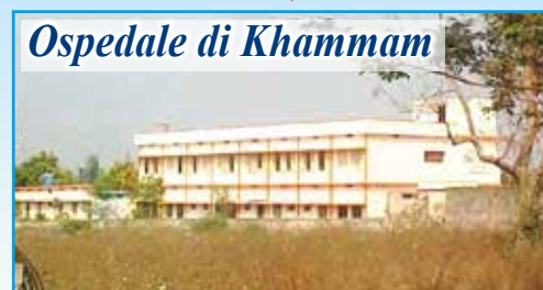
Ospedale di Khammam

In questo povero angolo dell'India, prosegue il nostro aiuto per la costruzione di pozzi d'acqua (ad oggi già scavati 40) e bagni a sostegno dei poveri villaggi della zona. In estate la temperatura arriva anche ai 45°C e la situazione diventa drammatica anche in campo sanitario. Ricordiamo che la somma necessaria per la realizzazione di un pozzo è di 500 euro e di un bagno di 250 euro . Con l'inaugurazione e l'apertura dell'Ospedale Pediatrico "DONO E CAREZZA DELLA MAMMA DELL'AMORE" nel villaggio di Morampally Banjara, dopo aver parlato con il Vescovo, l'associazione propone di "adottare a distanza" i bambini qui ricoverati (tutti sieropositivi o malati di AIDS) proprio per sostenere le spese di gestione, l'assistenza e le cure. Per ogni bambino sostenuto sarà richiesto un contributo annuale di almeno 200 euro .