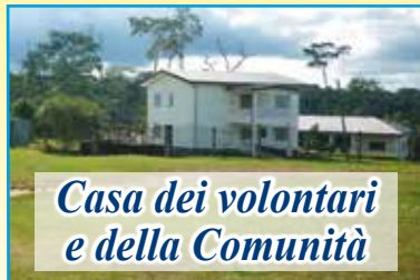
Casa dei volontari e della Comunità