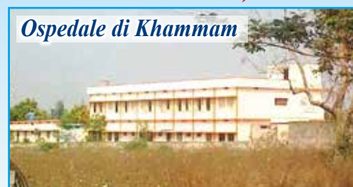
Ospedale di Khammam

In questo povero angolo dell’India, prosegue il nostro aiuto per la costruzione di pozzi d’acqua (ad oggi già scavati 36 pozzi) a sostegno dei poveri villaggi della zona. In estate la temperatura arriva anche ai 45°C e la situazione diventa drammatica anche in campo sanitario. Ricordiamo che la somma necessaria per la realizzazione di un pozzo è di 500 euro . Con l’inaugurazione e l’apertura dell’ Ospedale Pediatrico “Dono e carezza della Mamma dell’Amore” nel villaggio di Morampally Banjara, dopo aver parlato con il Vescovo, l’associazione propone di “adottare a distanza” i bambini qui ricoverati (tutti sieropositivi o malati di AIDS) proprio per sostenere le spese di gestione, l’assistenza e le cure. Per ogni bambino sostenuto sarà richiesto un contributo annuale di almeno 170 euro .