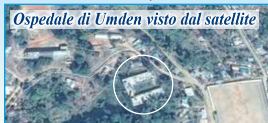
Ospedale di Umden visto dal satellite

Il costo per la costruzione si aggirava sui 225.000 euro . Ad oggi la nostra associazione ha mandato 165.000 euro, circa i tre quarti di questa somma. Grazie ad un accordo di fiducia reciproca, tra l’Ispettorato dei Salesiani, le ditte locali e alcuni magazzini di materiali edili, siamo riusciti ad avere una dilazione nei pagamenti e quindi ultimare tutti i lavori. È ancora fondamentale il nostro sforzo nel contribuire alle spese fatte che vanno liquidate nei prossimi mesi. Chi desidera può sempre sostenere questo impegno. La cosa importante è che ad oggi l’ospedale è stato ultimato ed è funzionante.