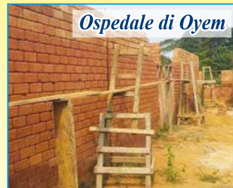
Ospedale di Oyem

IL PROGETTO: La posa della prima pietra dell'Ospedale "NOTRE DAME DU WOLEU-NTEM" è avvenuta a novembre 2011 alla presenza del Cardinal Javier Lozano Barragan . Abbiamo inviato subito i primi 30.000 euro al Vescovo Mons. Jean Vincent Ondo per la pulizia e preparazione del terreno. Ora ci dicono siamo pronti per la costruzione dell'edificio. A Roma nel novembre 2013 il fondatore Marco ha incontrato e presentato a Papa Francesco questo bel progetto che è la costruzione del primo Ospedale Cattolico dello stato gabonese. Per la costruzione della prima ala dell'Ospedale (preventivi rivisti a marzo 2015) servono circa 150.000 euro .