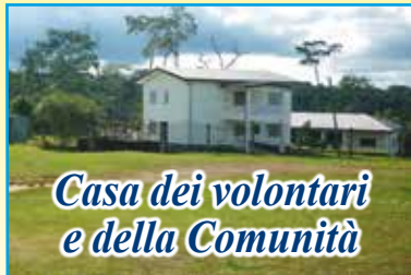
Casa dei volontari e della Comunità