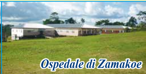
Ospedale di Zamakoe